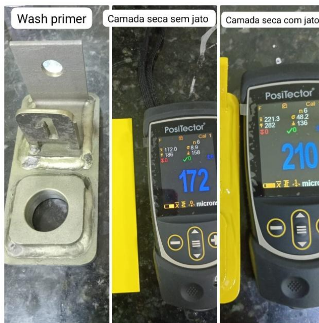
Imagem 2: Aplicação epóxi fosfato de zinco.

Após a cura em 24 horas, do REALPOXI 445 FAST CURE AMARELO, foi aplicado o esmalte PU acrílico alifático de dupla função (REALTHANE 585 DF), para auxiliar na proteção catódica e principalmente na proteção a intemperes e raios UV, evitando a calcinação do epóxi fosfato de zinco de alta espessura (REALPOXI 445 FAST CURE AMARELO), na camada seca em média de 80 \mu\text{m} por demão, ficando em média 252 \mu\text{m} aplicação final com espessura média ilustrada na imagem 3.