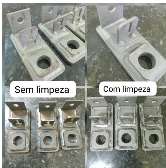
Imagem 1: limpeza com REALSURFACE FOSFATIZANTE.

As aplicações dos produtos ocorreram conforme indicações de uso encontrado nos boletins técnicos REALFIX, os substratos usados tratam-se de peças enviadas com geometrias específicas algumas jateadas outras não. Devido a oxidações e sujeira, as peças passaram por decapagem e fosfatização com REALSURFACE FOSFATIZANTE até remoção total dos focos de oxidação, graxa e sujeira, conforme imagem1.