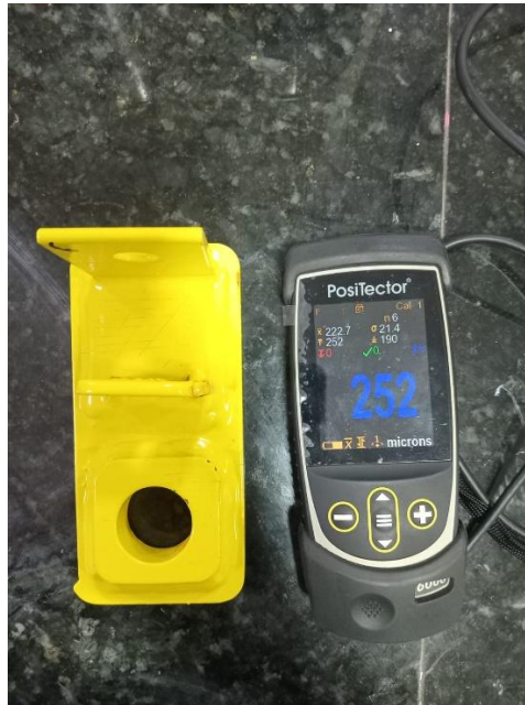
Imagem 3: aplicação REALTHANE 585 DF